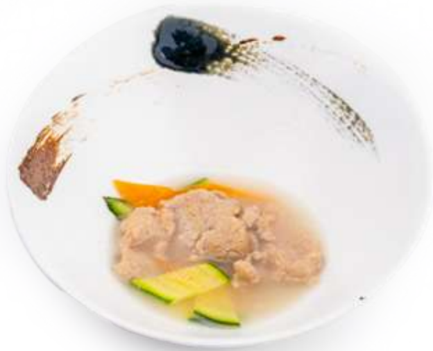
179. MANZO E VERDURE* € 8.00