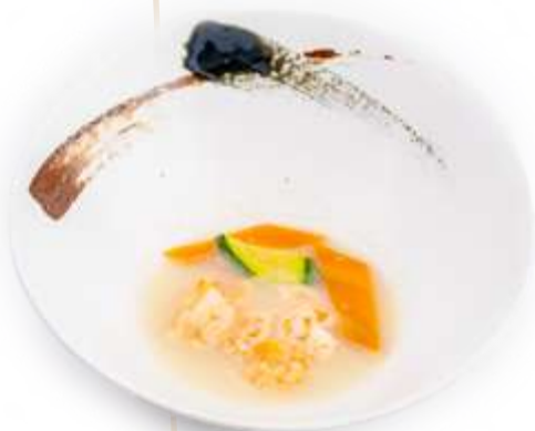
173. GAMBERI VERDURE*