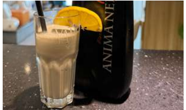
SORBETTO ANIMA NERA € 6.00