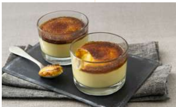
CREMA CATALANA € 6.00