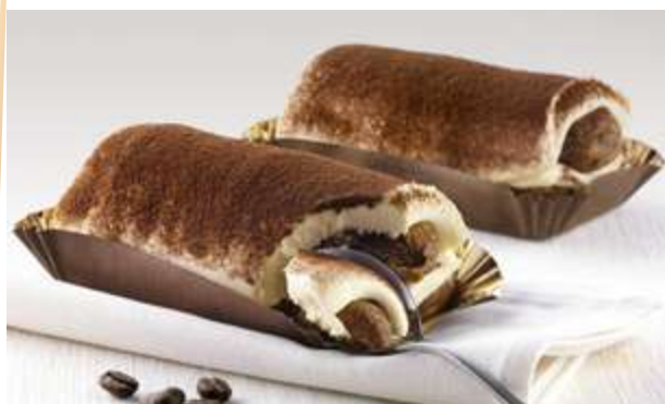
TIRAMISÙ € 6.00