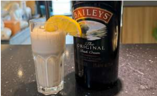
SORBETTO BAILEYS € 6.00