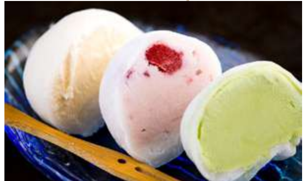
MOCHI MIX € 6.00