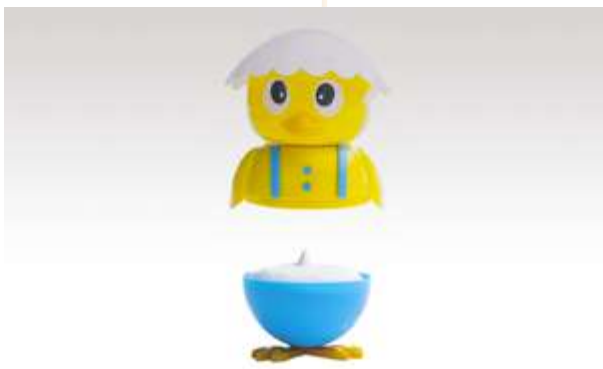
TWITTY GELATO FIOR DI LATTE € 5.00