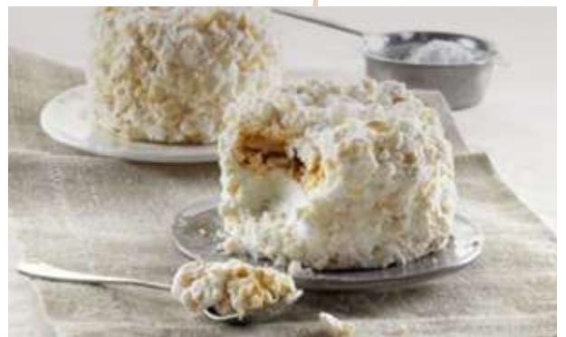
MERINGA € 6.00