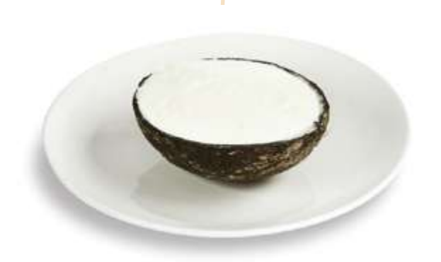
COCO RIPIENO € 6.00