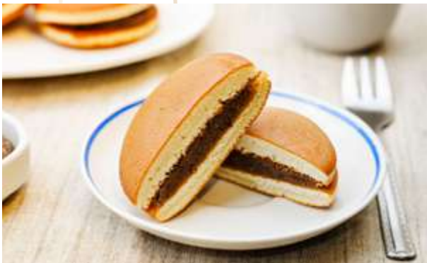
DORAYAKI € 6.00