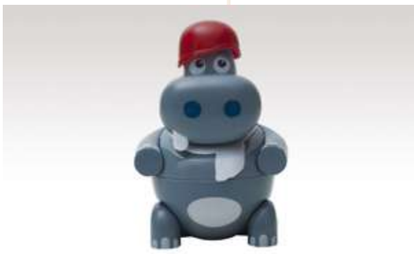
HIP POP GELATO FRANGOLA € 5.00