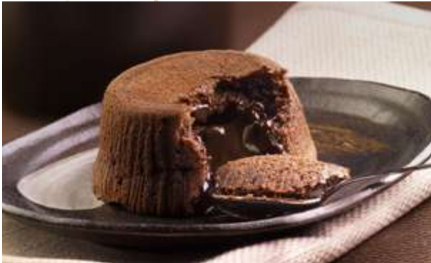
SOUFFLE AL CIOCCOLATO € 6.00