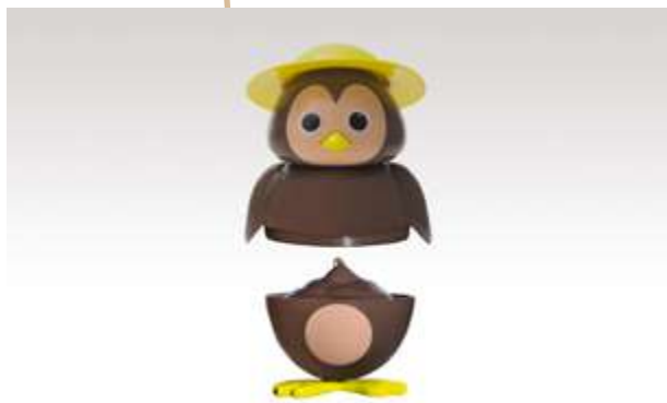
CIP CIOK GELATO CIOCCOLATO € 5.00