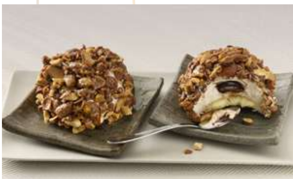
CROCCANTE ALLE MANDORLE € 6.00