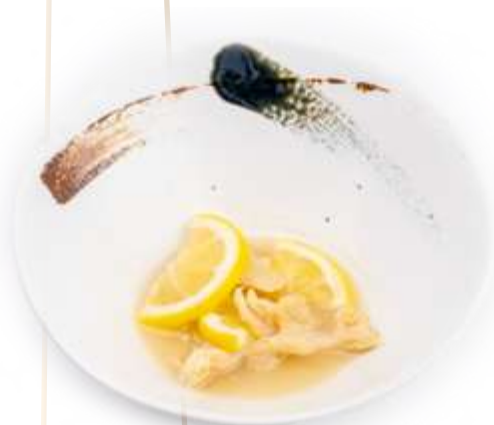
169. POLLO LIMONE*