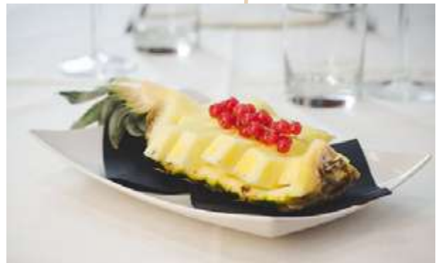
ANANAS FRESCO € 6.00