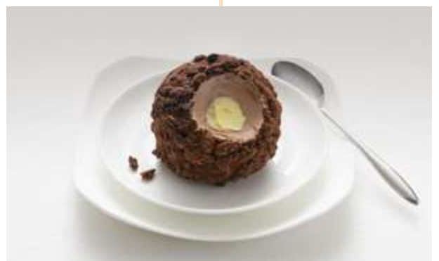
TARTUFO CLASSICO € 6.00