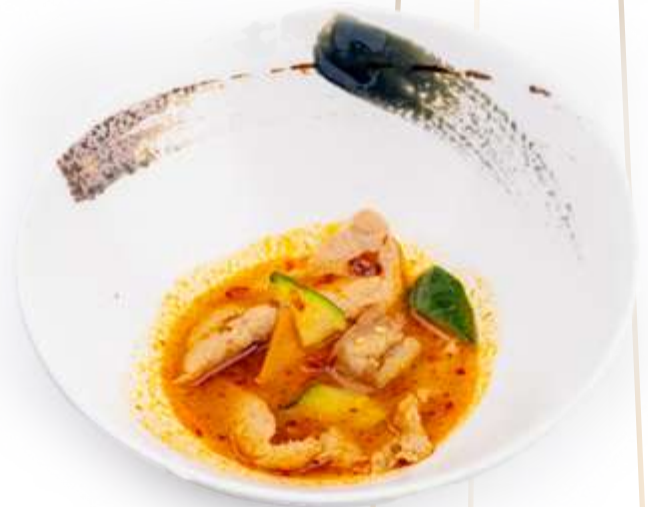
181. MANZO FUNGHI BAMBÙ* € 8.00