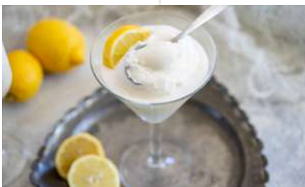
SORBETTO AL LIMONE € 5.00