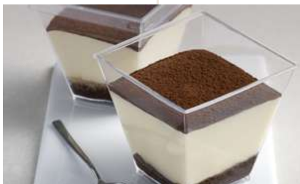
TIRAMISÙ SENZA GLUTINE € 6.00