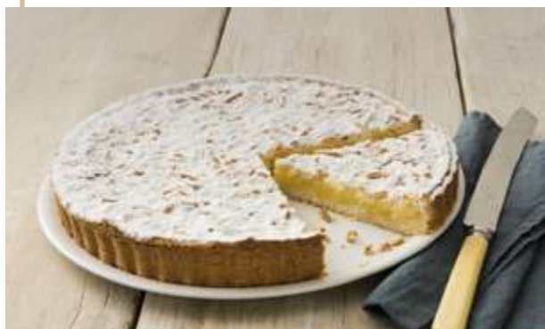
TORTA DELLA NONNA € 6.00