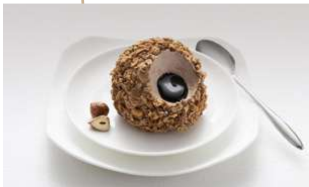
TARTUFO NOCCIOLA € 6.00