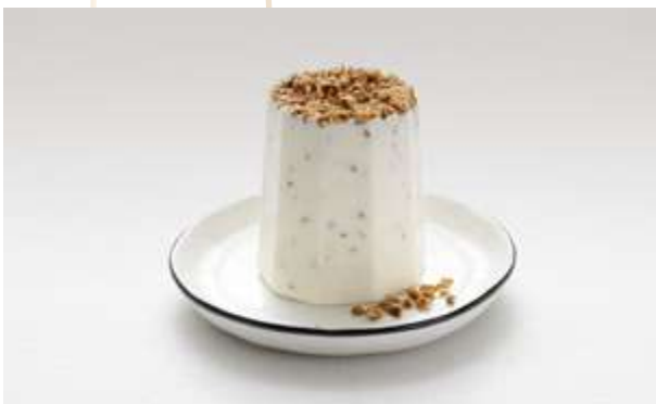
SEMIFREDDO TORRONCINO € 6.00