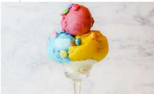
GELATO MIX € 6.00