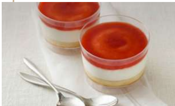
CHEESE CAKE ALLE FRAGOLE € 6.00