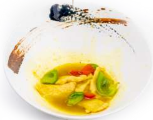
170. POLLO CURRY*