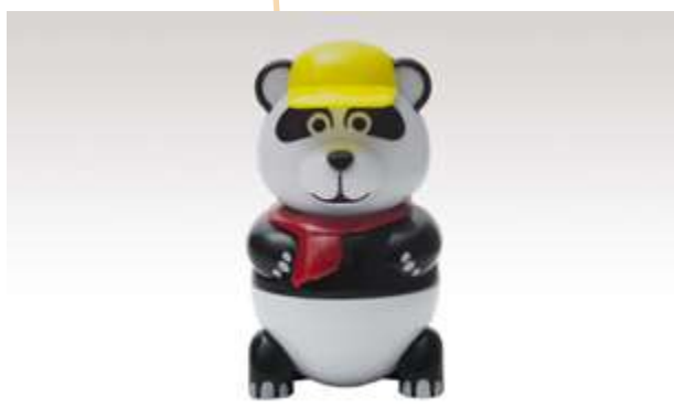
PAN DAN GELATO VANIGLIA € 5.00