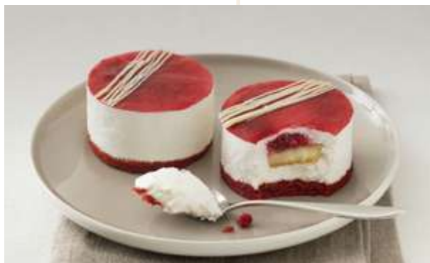
CREMOSO FRUTTI ROSSI € 7.00