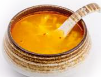
26. ZUPPA AGROPICCANTE* Zuppa di uova, verdure e carne agropiccante € 5.00