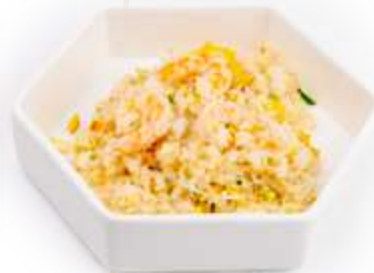
134. RISO GAMBERI* Riso saltato con gamberi, verdure e uova