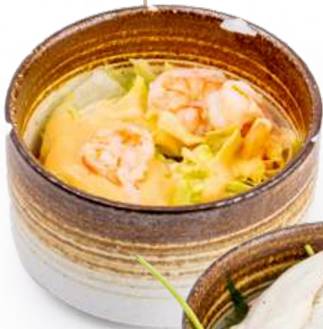
● 20. COCKTAIL DI GAMBERETTI* Gamberetti in salsa cocktail € 6.00