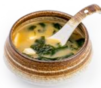
24. MISO SHIRO* Zuppa di miso con alghe e tofu € 5.00