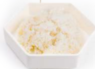
131. RISO BIANCO* Riso bianco € 3.00