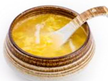
27. ZUPPA MAIS* Zuppa di mais, uova e granchio € 5.00