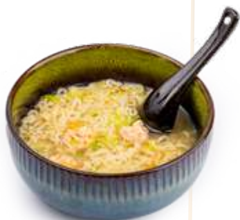
129. EBI RAMEN* Noodles in brodo con gamberi, verdure e uova