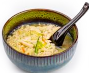
130. CHICKEN RAMEN* Noodles in brodo con pollo, verdure e uova