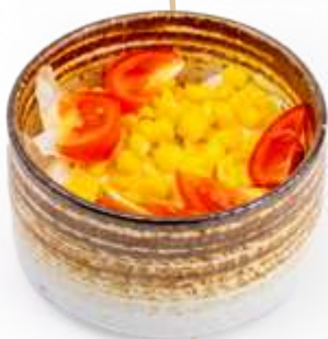
22. INSALATA MIX* Insalata, mais e pomodori € 5.00