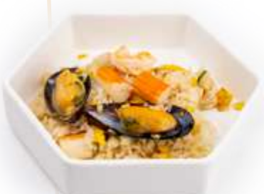
136. RISO FRUTTI DI MARE* Riso saltato con uova, verdure e frutti di mare