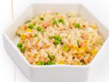
133. RISO CANTONESE* Riso saltato con uova, prosciutto cotto e piselli