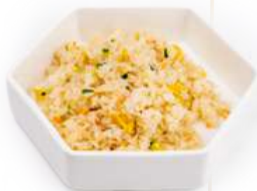
132. RISO VERDURE* Riso saltato con uova e verdure