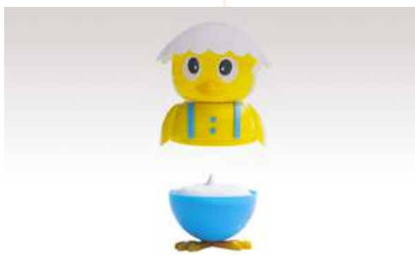
TWITTY GELATO FIOR DI LATTE € 5.00