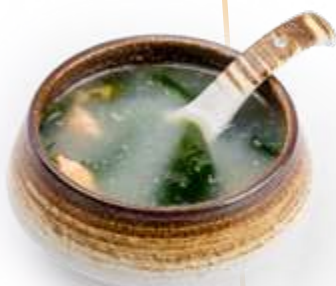
● 25. OSU MESH I* Zuppa di alghe, uova e frutti di mare € 5.00