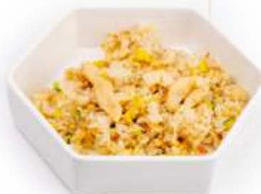
135. RISO CHICKEN* Riso saltato con pollo, uova e verdure