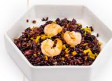
137. RISO VENERE EBI* Riso venere saltato con gamberi, verdure e uova