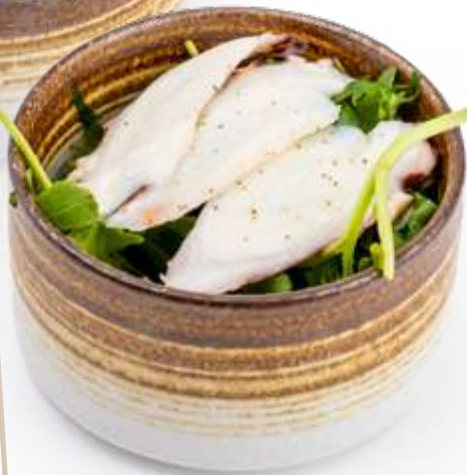
● 21. POLPO RUCOLA* Fettine di polpo con rucola e limone € 6.00