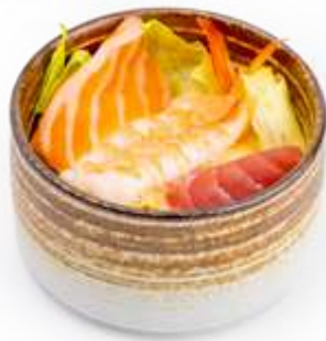
23. INSALATA DI MARE* Insalata e pesce misto € 8.00