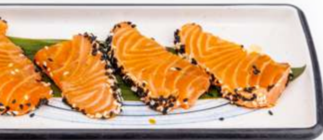
156. SAKE TATAKI* Salmone scottato, sesamo e salsa ponzu